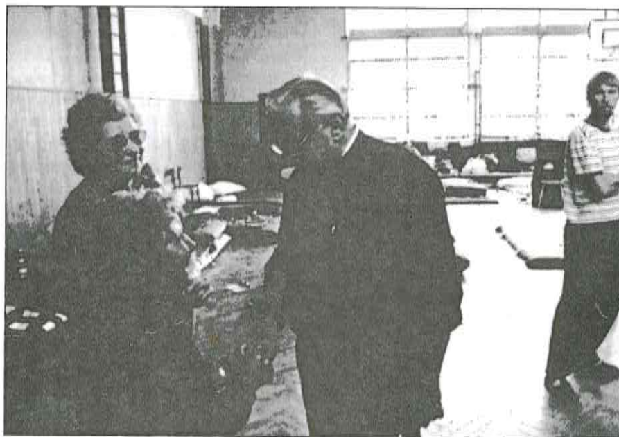
... a s lidmi dočasně ubytovanými v ZŠ Františka Stupky.