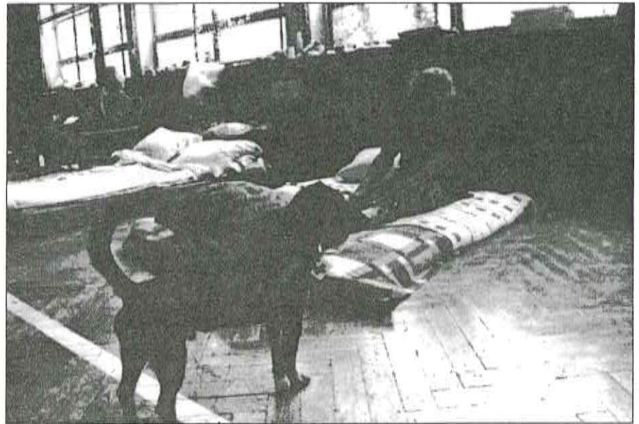
V olomouckém evakuačním středisku.