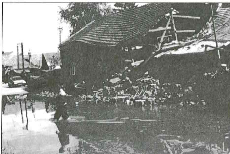
Černovír, pátek 11. července, 17 hodin